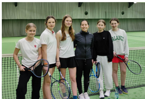
Freundschaftsspiel U15/U18 Juniorinnen bzw. Junioren